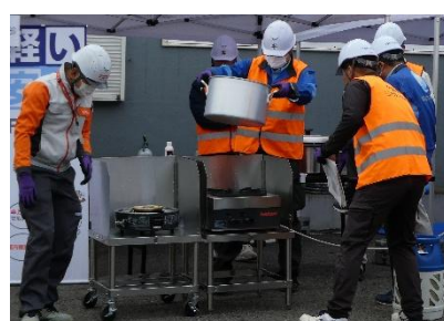
【印旛支部による避難施設への供給訓練】