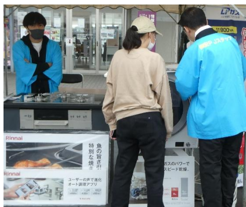
【LPガス機器に興味津々！】