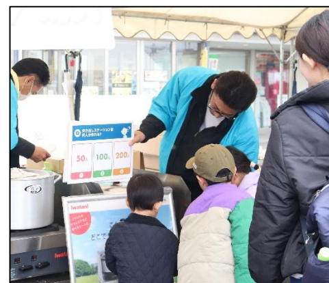
【クイズに挑戦！正解できるかな？】