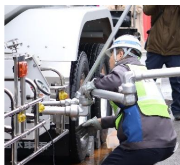
【ローリー車から基地へガス受入】