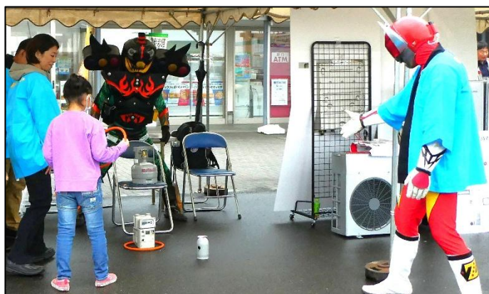
【ガスホースの輪投げに挑戦！】