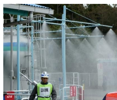
【散水機器の稼働訓練】