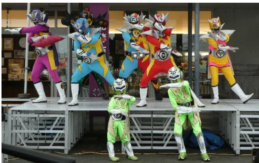
【カトレンジャーZ勢揃い！】