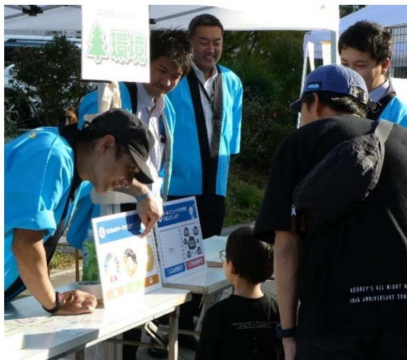
【クイズに挑戦！正解できるかな？】