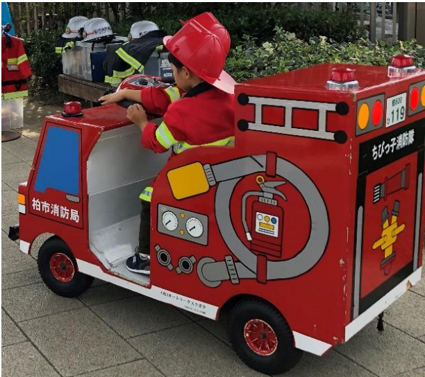
【ミニ消防車へ乗車！！】