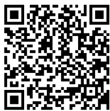
QRコード：聖火ランナー動画

かくして、千葉県LPガス協会香取支部の夢と希望を一身に背負った私は、聖火という命が宿ったトーチを握り、持ち時間10秒のパフォーマンスに全てを懸けるため、軽快なステップでステージ中央へ向かいました。