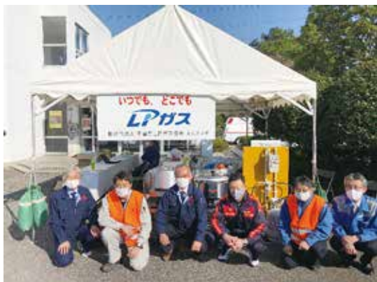
【木更津支部の皆さん】

去る11月17日(火)、午後1時より、袖ヶ浦市長浦消防署(袖ヶ浦市長浦580-146)に於いて、令和2年度千葉県高圧ガス輸送車等防災訓練が実施されました。