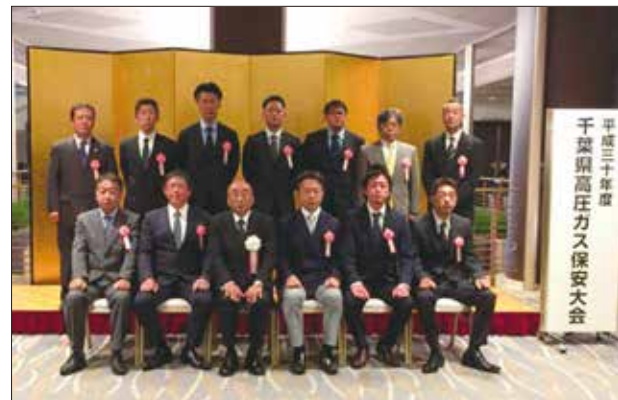
【協会長表彰受賞者の皆様】