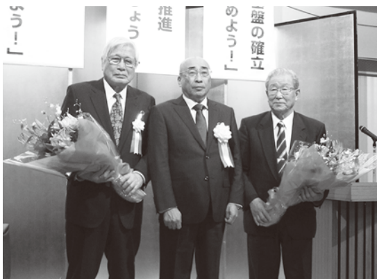
【小野口前相談役・小倉新会長・横山新相談役】

去る5月22日(火)、午後3時より、三井ガーデンホテル千葉(千葉市中央区中央1-11-1)に於いて、一般社団法人千葉県LPガス協会第6回定時社員総会並びに全国LPガス政治連盟千葉県支部第43回通常総会