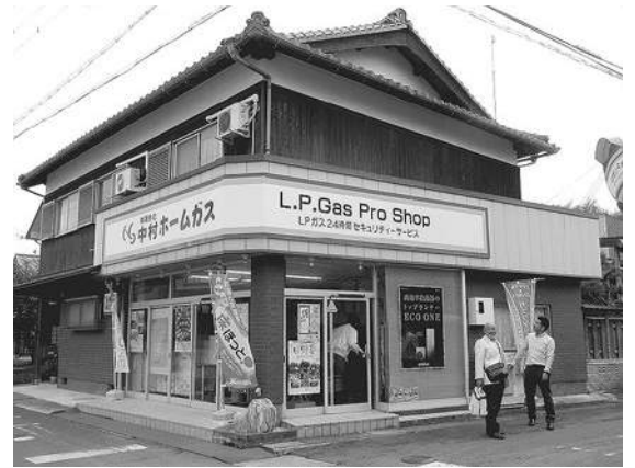
【有限会社中村ホームガス店舗外観】

一例としては、配送等の一部を業務委託していたが、集中監視システムを導入していたこともあり、自社で配送することに転換したことでコスト意識が高められ、また、自社配送したことでお客様と接する機会が増えたことでお客様からの信頼を得ることができたことが再認識でき、“コツコツやれば絶対できる”ことを実感したとのお話がありました。