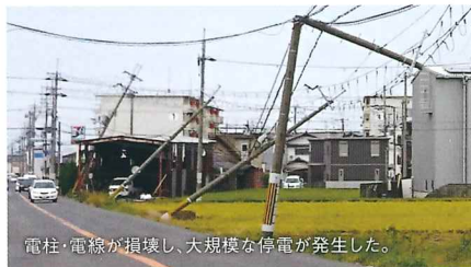
電柱・電線が損壊し、大規模な停電が発生した。

はい、平成30年の9月4日に当市を襲った台風21号です。このときは電柱がなぎ倒され、長期の停電も生じ、市民生活に大きな支障が出ました。それから1カ月も経たないうちに、同規模の勢力をもつ台風24号に襲われることとなり、約800人の市民が体育館に避難しました。9月のまだ暑い時期という厳しい環境の中で、高齢者も多かったことから、避難所として使う体育館の、空調整備の必要性を強く感じたのです。そこで、災害に強い動力源とされているLPガス仕様のGHP(ガスヒートポンプエアコン)を導入することにしました。