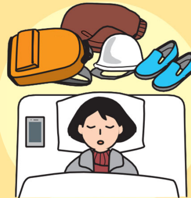
すぐに逃げられる態勢の維持